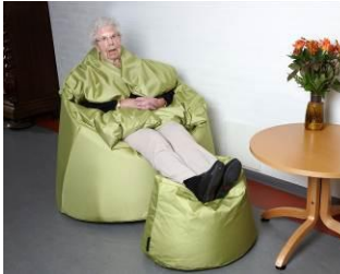
Farboptionen auf Anfrage.

Ein die Sinne stimulierender Sessel mit „Hüllencharakter“, der beruhigend wirkt.